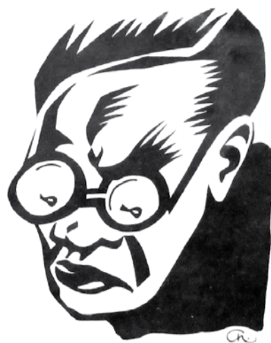
А. М. РЕМИЗОВ Махатма-Ганди изъ Пасси И авторъ «Взвихренной Руси».